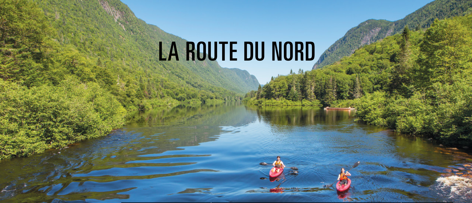
PARC NATIONAL DE LA JACQUES-CARTIER