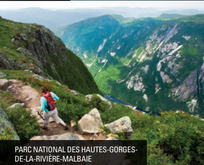
PARC NATIONAL DES HAUTES-GORGES-DE-LA-RIVIÈRE-MALBAIE